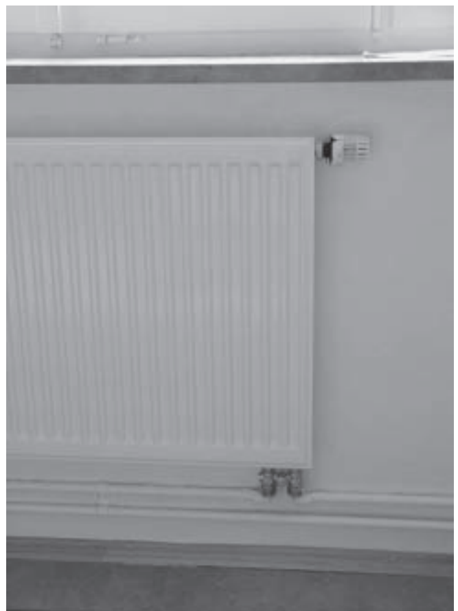
Abb. 2. Strahlplatte einer Hüllflächentemperierung.

Wärmestrahlung erwärmt als elektromagnetische Welle keine Luft, sondern nur Materie. Glas ist für Wellenlängen unter 0,3 \mu\text{m} (UV-Strahlung der Sonne) und über 2,7 \mu\text{m} (langwellige Wärmestrahlung) praktisch undurchlässig [7]. Die kurzwellige Solarstrahlung und das Licht durchdringen das Fensterglas und werden beim Auftreffen auf Materie in Wärme und dann in langwellige Wärmestrahlen verwandelt [8]. Diese werden dann als Strahlungsheizung (Kaminfeuer, Kachelofen, temperierte Wand, Strahlplatte) von Glas reflektiert und bleiben im Raum. Der Strahlungsausgleich erwärmt die Raumschale gleichmäßig. Die Sonne strahlt direkt und diffus – deshalb profitiert auch ein Nordfenster davon. Für Strahlung gelten die Gesetze der Quantenmechanik. Die im Fensterbau hingegen thermodynamisch berechneten Energieverluste liefern falsche Ergebnisse [9]. Schon Einfachfenster ohne Gummidichtung genügen, um einen strahlungsbeheizten Raum behaglich zu halten, die notwendige Fugenlüftung sicherzustellen und als Sollkondensator Wandfeuchte und Schimmel sicher zu verhindern. In kondensatgefährdeten Nass- und Schlafräumen sind Einfachfenster der billigste Schimmelschutz. Durch Strahlungsheizung kann die Raumlufttemperatur wesentlich gesenkt werden. Das spart Energie.