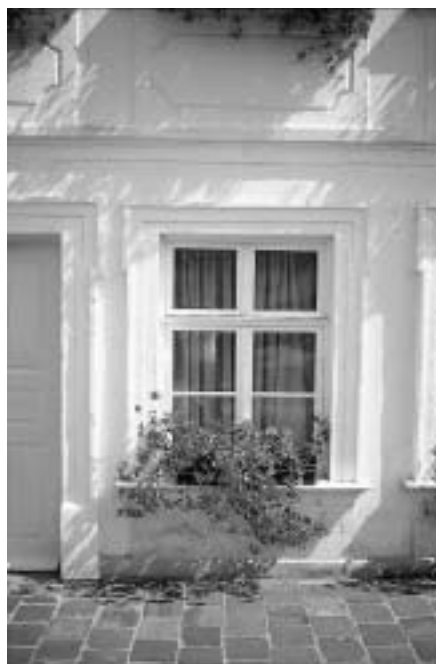
Fensterbau gestern ...