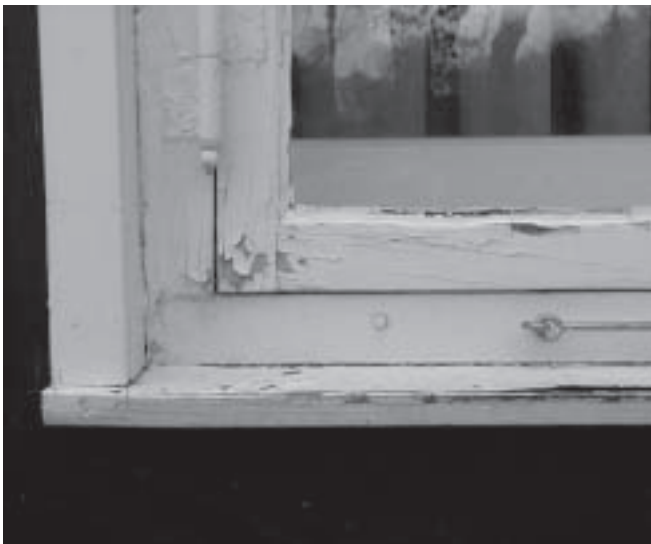
Abb. 1. Kastenfenster, durch Kunstharzanstrich beschädigt.

Der Wärme-, Schall- und Feuchteschutz sowie die Lebensdauer und Wartung bestimmen die Bauphysik des Fensters. Die historischen Fenster haben diesbezüglich auf ausgereifte Erfahrung zurückgegriffen [2]. Erst der moderne Fensterbau liefert für teures Geld schimmelige Wohnräume und fordert anstelle behaglichen Wohnens Lüftungstechnik [3]. Historische Konstruktionen sind einfach, dauerhaft und sinnfällig [4]. Ihr Rahmenmaterial Holz und ihre Bauart überzeugen technisch und wirtschaftlich. Wartung und Reparatur von alten Holzfenstern lohnen sich immer, solange man substanzschonende Entlackungsmethoden, giftfreien Holzschutz mit Festigungseffekt, reine Ölfarben und keine versprödungsanfälligen Harzlacke einsetzt [5]. Erst die modernen holzerstörenden Fensterfarben haben den Ruf des Holzfensters beschädigt. Ihre spröden Dichtschichten sind auf Holzuntergründen nicht witterungsstabil und nach einem Jahr oft schon defekt [6].