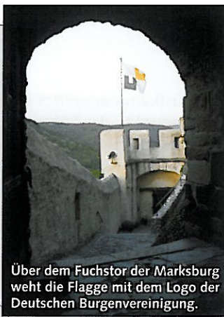
Über dem Fuchstor der Marksburg weht die Flagge mit dem Logo der Deutschen Burgenvereinigung.

Die DEUTSCHE BURGENVEREINIGUNG e.V. zur Erhaltung der historischen Wehr- und Wohnbauten wurde 1899 gegründet und ist die älteste überregional tätige Denkmalschutzinitiative in Deutschland. Sie erforscht die Geschichte von Burgen und Schlössern und publiziert die Ergebnisse; sie veranstaltet Symposien und Seminare, Exkursionen und Ausstellungen. Auf der vereinseigenen Marksburg befindet sich die Bundesgeschäftsstelle der Vereinigung. Im Schloss Philippsburg, seit 1997 ebenfalls im Besitz der Burgenvereinigung, ist ihr Europäisches Burgeninstitut mit großer Bibliothek, Archiv und Plansammlung untergebracht.