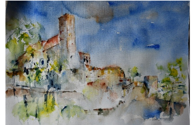
Rietburg (Aquarell, J. Doer, 2023)